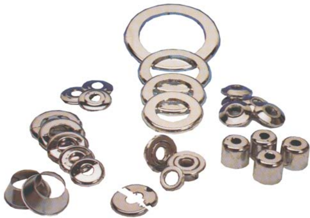
CANOPIES / ROSACES