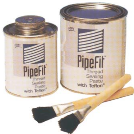
TEFLON PASTE / SCELLANT À JOINT