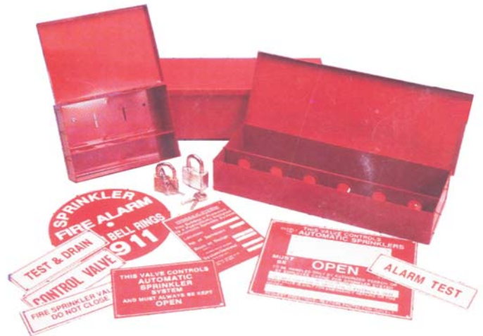
ENGLISH SIGNS / ENSEIGNES EN FRANÇAIS HEAD CABINET / CABINETS À GICLEURS